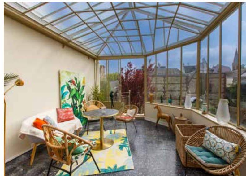
Ci-dessus / ci-contre : Rotin et couleurs chamarrées apportent une note exotique sous le ciel de la Côte Fleurie.