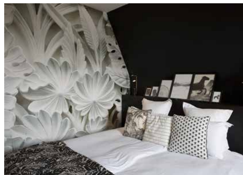
Ci-dessus : La chambre en noir et blanc révèle son caractère bien affirmé.