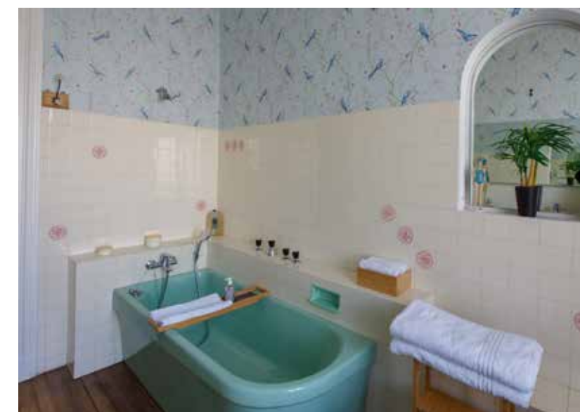
Ci-dessus : La baignoire, avec ses lignes modernes, n'avoue pas son âge. Elle est là depuis les années cinquante.