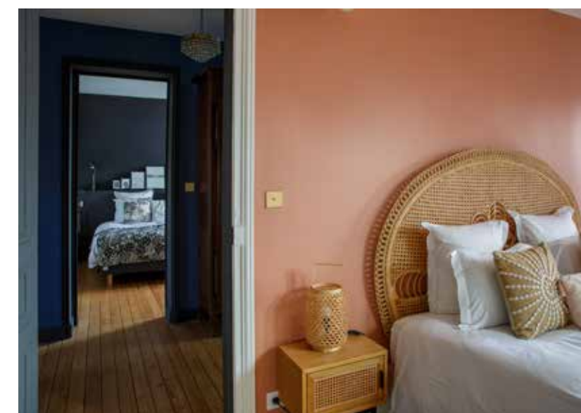
Ci-dessus : Couleurs chaudes et osier pour une note seventies.