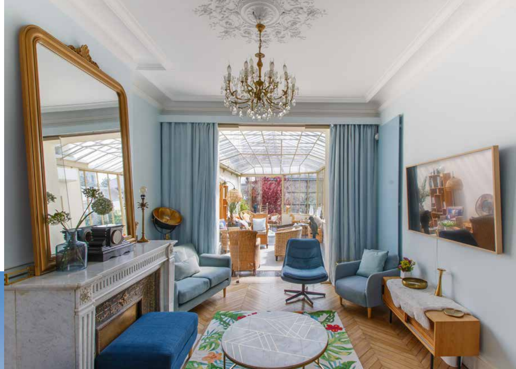
Ci-dessus : L'enfilade des salons prolongée par la véranda procure une sensation d'espace illimité.