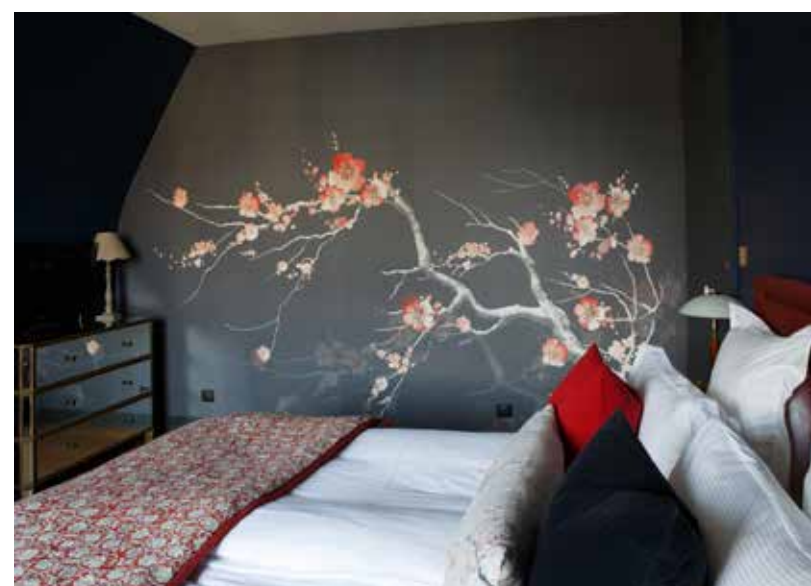
Ci-dessus : La chambre aux tonalités rose et rouges s'inspire des cerisiers japonais.