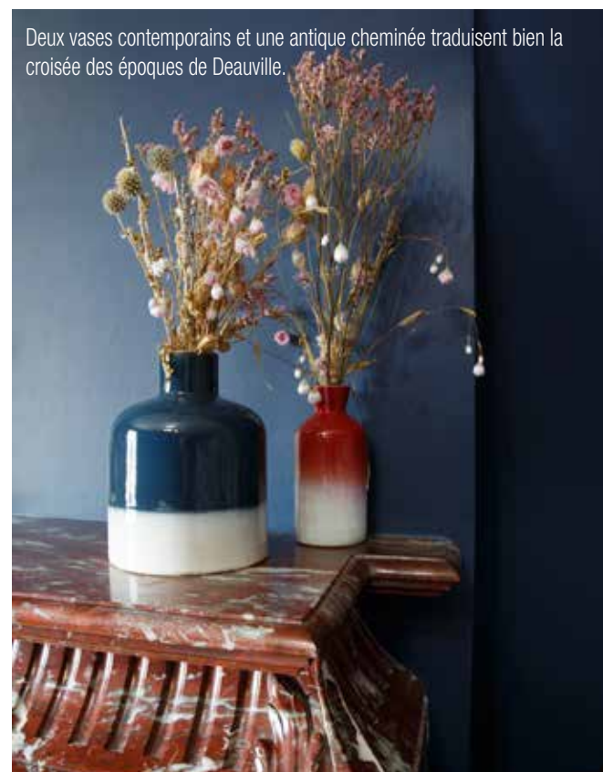
Deux vases contemporains et une antique cheminée traduisent bien la croisée des époques de Deauville.