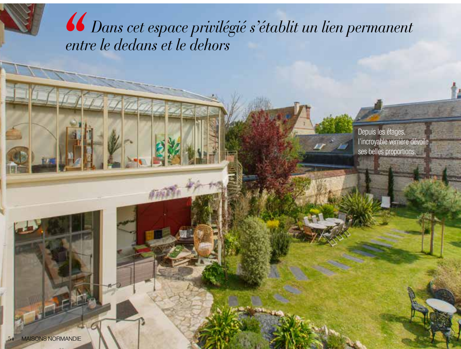
Depuis les étages, l'incroyable verrière dévoile ses belles proportions.

“ Dans cet espace privilégié s'établit un lien permanent entre le dedans et le dehors ”