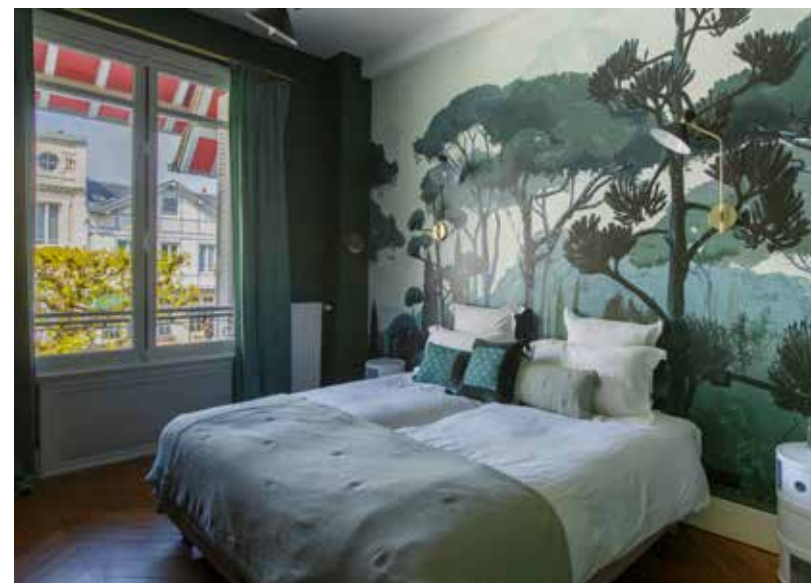
Ci-dessus : Chaque chambre arbore une ambiance colorée, celle du premier étage se pare d'un nuancier de verts.