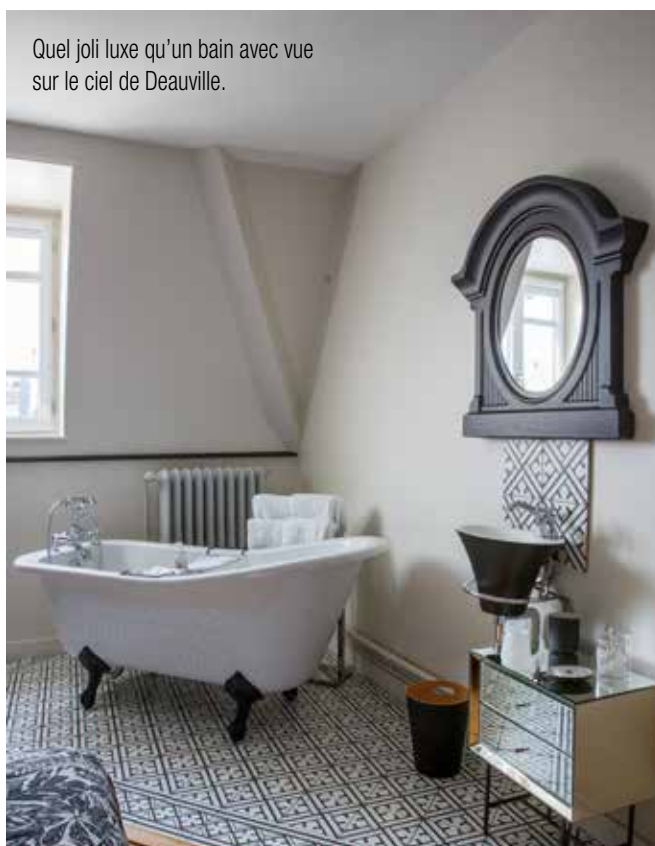
Quel joli luxe qu'un bain avec vue sur le ciel de Deauville.