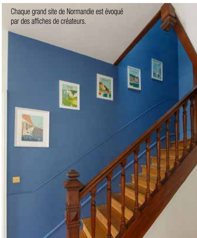
Chaque grand site de Normandie est évoqué par des affiches de créateurs.

“ Depuis le XIX ème jusqu'à nos jours, la Côte Fleurie inspire les artistes et les esthètes