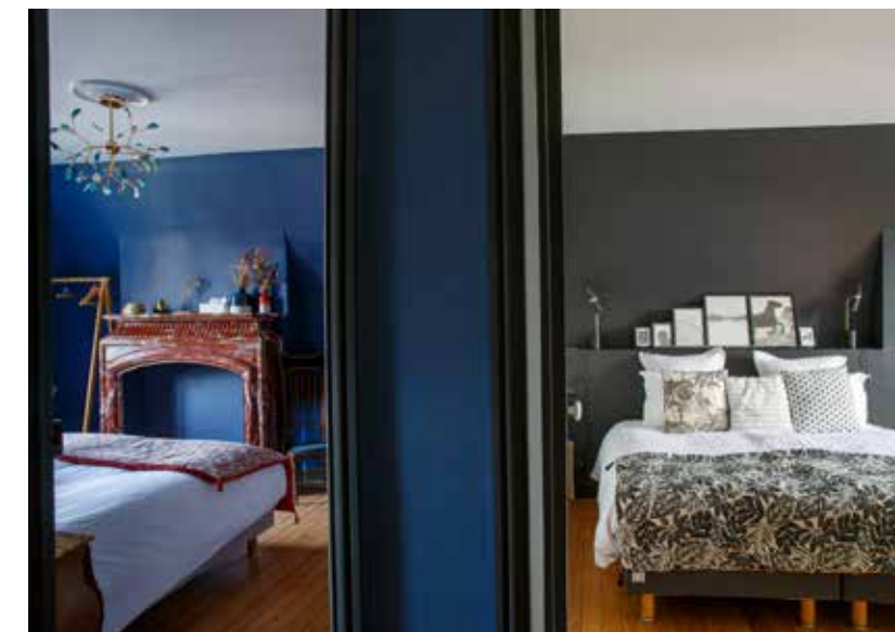
Ci-dessus : Avec pour seul point commun le soin apporté au décor, chaque chambre est unique.